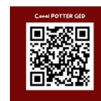
Figuras 1 e 2. Identidade visual Potter Cast e QR Code de acesso